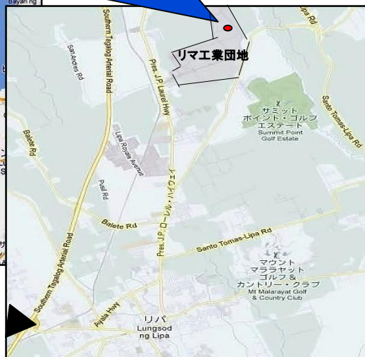
フィリピンバタンガス州リマ工業団地内 (マニラ首都圏より車で80分程度)